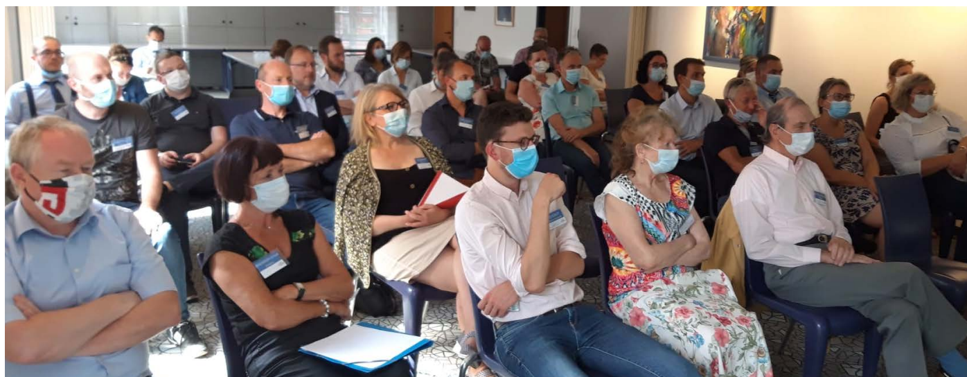
Kick off de Guebwiller (Alsace) - 08/07/20