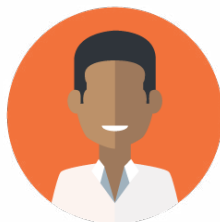
Services (hors médical)