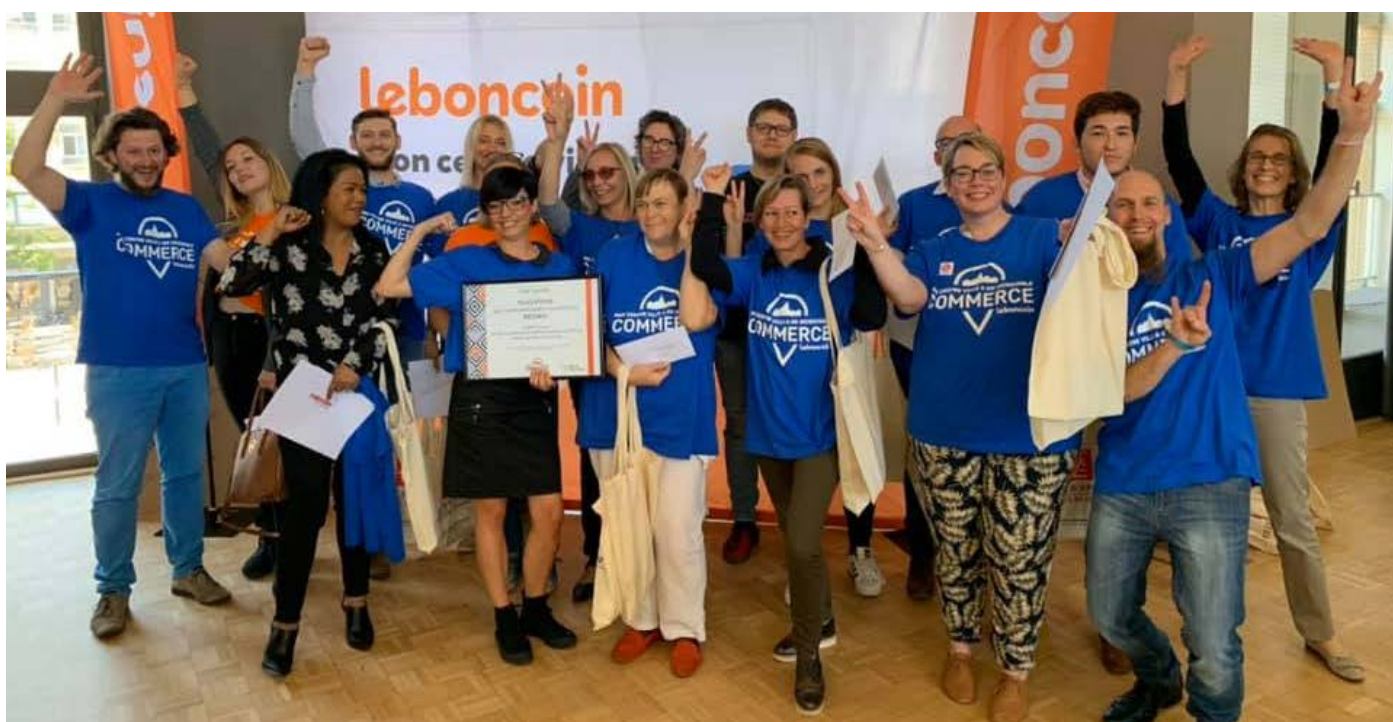
Porteurs de projets de Valenciennes (Nord) après la remise des prix - 09/19

Les prix seront amenés à changer en fonction des territoires, de ses spécificités et des éventuels partenaires locaux.