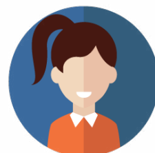
Associations et collectifs citoyens

Tous les projets allant dans le sens d'une revitalisation du centre-ville sont aussi les bienvenus : tiers lieux (fablab, espace de coworking) ou tout autre service inédit à destination des commerçants – habitants en centre-ville.