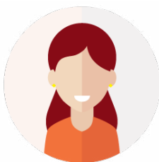
Commerces et artisans (hors franchises)

Toutes les activités en cours de création et ayant besoin d'un local, d'un emplacement, ainsi que les activités déjà installées en centre-ville impactées par la Covid-19 sont éligibles au dispositif :