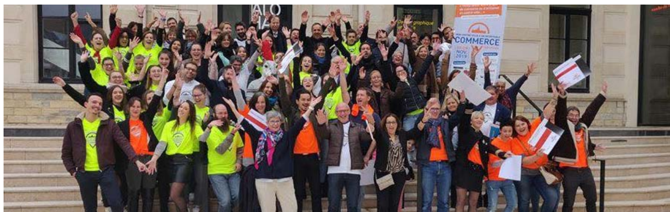
Seconde édition de Chaumont - novembre 2019