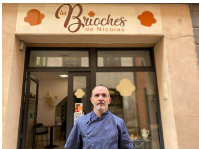
Les Brioches de Nicolas à Carpentras - ouvert en mars 2020