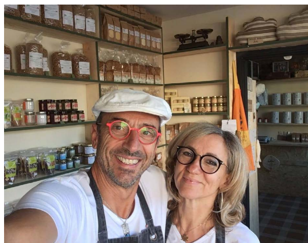
Graines de bonheur à Vitry le François - ouvert en septembre 2019