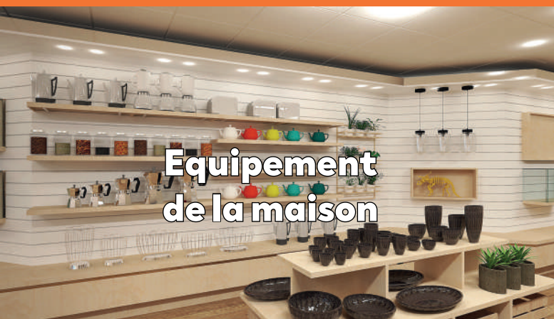
Equipelement de la maison