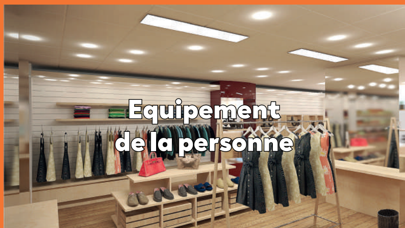
Equipelement de la personne